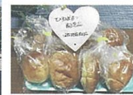
西盛堂さんのパン