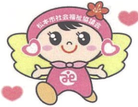
松本市社会福祉協議会キャラクター つむぎちゃん