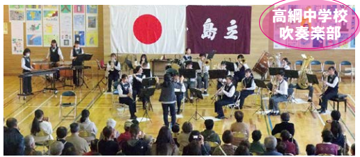
高網中学校 吹奏楽部