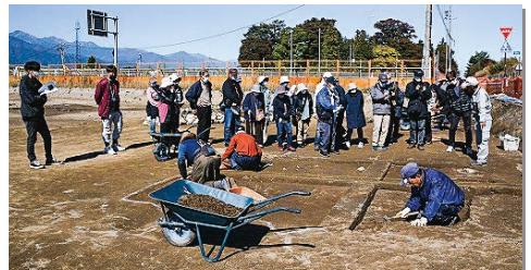
発掘調査見学会の様子は公民館島立版 令和4年9月号、11月号で

西に向かう野麦街道(飛驒道)、北に向かう千国街道・仁科街道が区内を通過しており、越中富山や糸魚川などとの交易の重要拠点でした。古くは縄文の遺跡があり、高速道路工事に伴う発掘調査では、奈良・平安時代の複合住居跡が確認されました。左波理椀(銅合金の椀)や釉薬のかかった焼物が出土し、身分の高い人が住んでいたと考えられます。