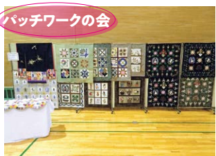
パッチワークの会