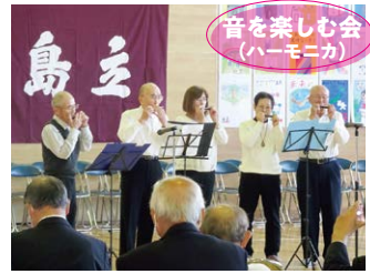
音を楽しむ会 (ハーモニカ)