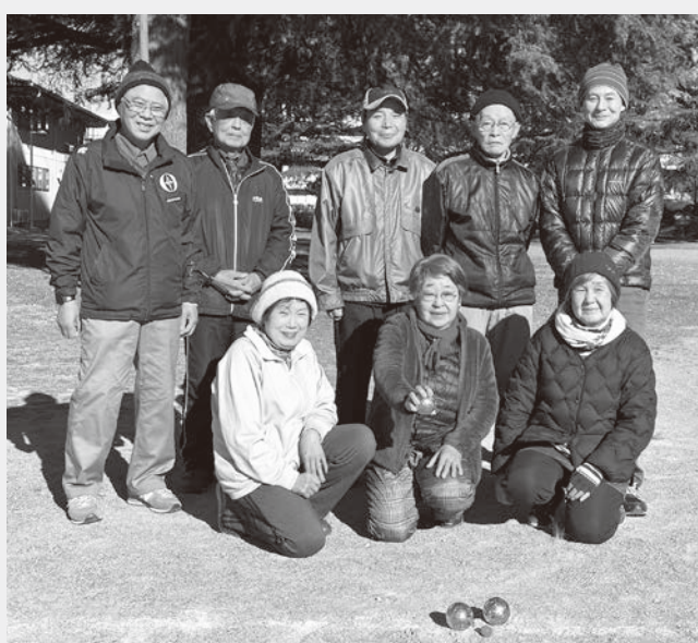
月に2回の全員練習(蚕糸記念公園グラウンド)

「ねんりんピック愛媛2023」は令和5年10月に行われます。60歳以上の幅広い方が参加できる10種目の競技が繰り広げられます。