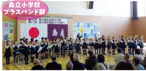
島立小学校 プラスバンド部

感染症対策を講じながら、ステージ発表、作品展示発表を行いました。内容の一部を写真でご紹介します。