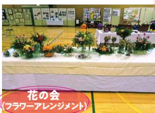
花の会 (フラワーアレンジメント)