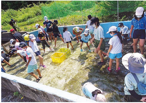
森・杜探検隊ヤマメのつかみ取り

西の玄関口 人口6686人(世帯数2911)、長野自動車道松本IC、長野県合同庁舎、松本市歴史の里、長野県松本筑摩高等学校、松本市立高綱中学校・島立小学校があります。コロナ禍でさまざまな活動が停滞していましたが、子どもを取り巻く活動は徐々に戻りつつあります。