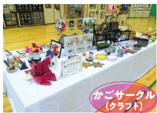
かごサークル (クラフト)