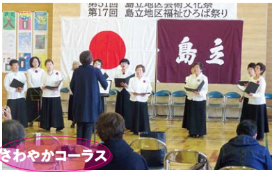
さわやかコーラス