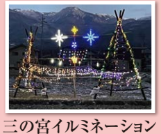
三の宮イルミネーション