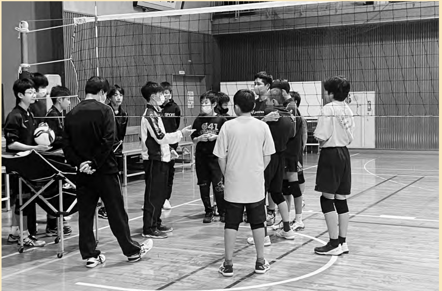
チームKANAME (詳細情報は2ページに記載)