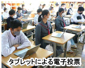
タブレットによる電子投票

生徒会引継ぎ ：生徒会引継ぎについては、先月号でも候補者による 教室訪問 の様子をお伝えしましたが、11月21日(月)には 立会演説会・投開票 、翌22日(火)には 決選投票 が行われ、次期生徒会の中核を担う、正副会長が選出されました。特に、集大成とも言える21日の 立会演説会 では、3週間にわたる選挙活動で練り上げた自分の公約を、堂々と主張する候補者の頼もしい姿が見られました。なお、次期生徒会正副会長は、次の3名が選出されました。