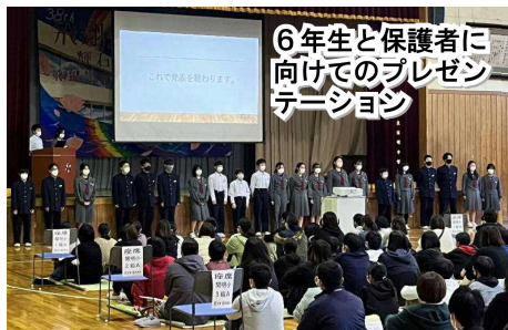
6年生と保護者に向けてのプレゼンテーション

新入生学校見学・保護者説明会 ：11月25日(金)、小学6年生と保護者を迎え、 新入生学校見学・保護者説明会 が行われました。当日は、6年生が授業の様子を実際に見学し、中学校生活についての説明を受け、4ヶ月後に迫った入学に向けての気持ちを高めました。小学校の先生方からも「中学校生活に対する不安が大きかった児童たちが、実際の授業を見たり、先輩からの具体的な話を聞いたりして、期待