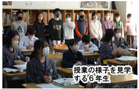
授業の様子を見学する6年生

もふくらんだようです。ありがとうございました。」といった声が寄せられました。今回の受け入れについては、1年生全体で準備を進め、当日は、2・3組が学級閉鎖だったため、1組がプレゼンテーションを行いました。また、飛翔祭で発表した1学年合唱「変わらないもの」の映像を通し、中学生として立派に活躍している姿を見ていただくこともできました。1年生が、「憧れの先輩、へと、確実に成長していることを実感できる行事となりました。✿✿✿✿✿✿✿✿✿✿