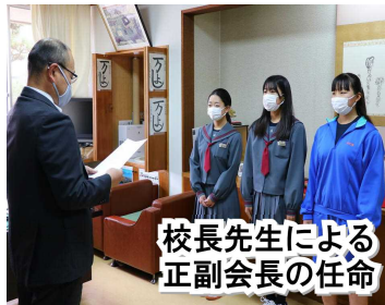
校長先生による正副会長の任命