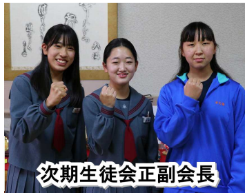
次期生徒会正副会長