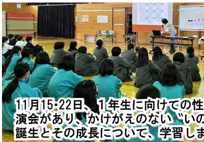
11月15-22日、1年生に向けての性教育講演会があり、かけがえのない『いのち』の誕生とその成長について、学習しました。