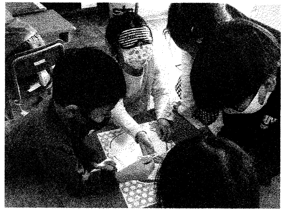
1年 生活科(ふくわらい)授業より

豆知識を一つ。年賀状の最後のところに今年だったら「2023年 元旦」と書きますね。この「元旦」というのはいつのことをさすのでしょうか。1月1日のこと？違います。1月1日は「元日」。「元日」というのは、実は元日の午前中をさしています。もっと言えば、元日の朝、日が昇ってからしばらくの時間をさしています。この「旦」という漢字が表しているものはこれです。太陽が水平線から昇った景色を切り取って漢字にしたんですね。太陽が昇る所は見たことありますか？夕方太陽が沈む所はよく見ると思いますが、昇る瞬間はあまり見たことがないのではないでしょうか。2023年卯年の1月1日、一年で最初の日の出を見る