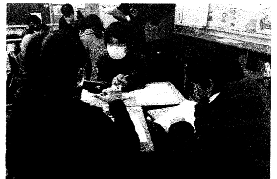
5年 算数グループ学習より