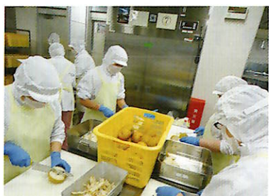
▲学校給食 調理の様子