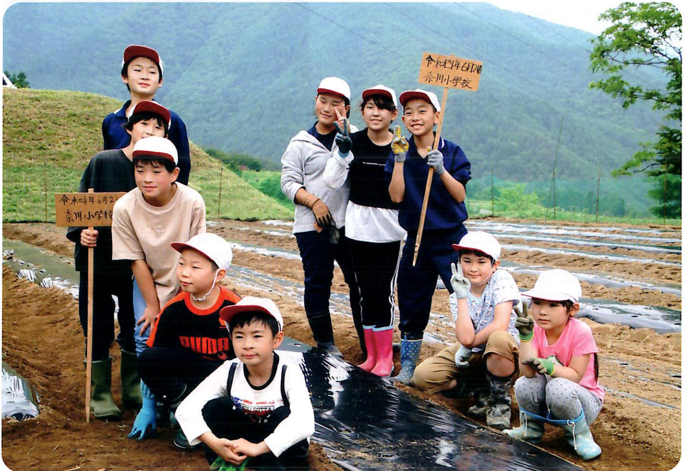
(奈川小学校の児童とトウモロコシ栽培)