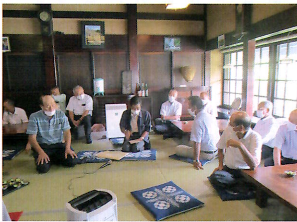
▲番所での研修風景

番所は標高1300m。この高地でないとミズミズしくはなりません。800mくらいの処で栽培したらパ