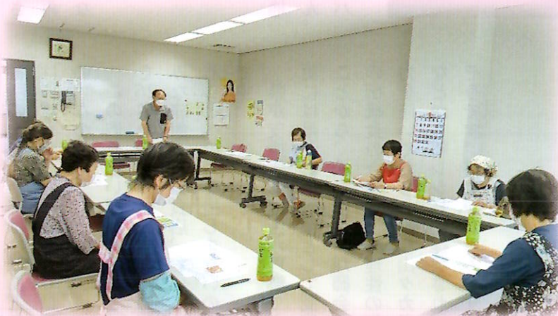
▶農業委員との懇談会