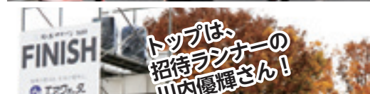
トッパは、 招待ランナーの 川内優輝さん！