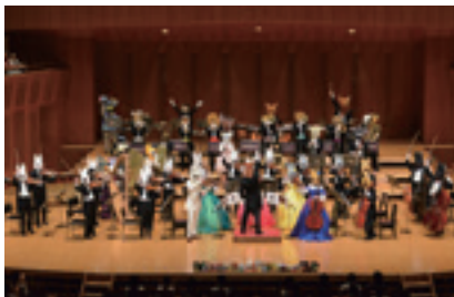
ズーラシアンフィルハーモニー管弦楽団

窓口、または電話でザ・ハーモニーホール (☎47-2004 ☎47-2383) へ