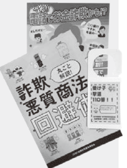
グッズも活用しよう

体的な詐欺内容を地域づくりセンター入口に掲示するほか、「詐欺の詳細を知らせる出前講座」「蟻ヶ崎高校書道部に依頼し、啓発文の掲示」などを実施しています。