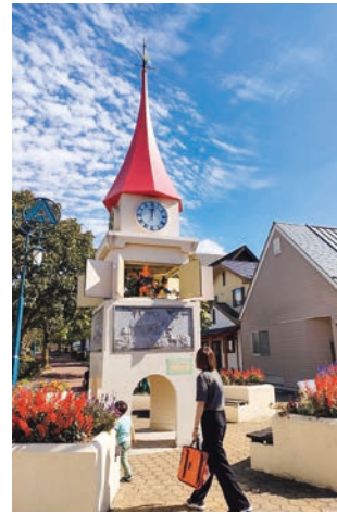
秋晴れのからくり時計

地区の中心に松原モールがあります。モールの中核部には「からくり仕掛けの時計台」が立ち、松原地区の宝として住民を見守っています。