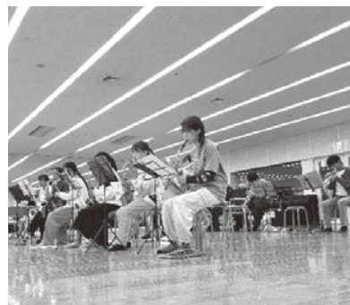
仲間と話し、一緒に演奏を完成させる

次の演奏の舞台は、12月25日にMウイングで開催されるクリスマスコンサートです。仲間とつくり上げる唯一無二の音色が、これからも多くの人に感動を与えます。