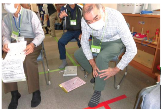
10月13日フレイル健診の様子