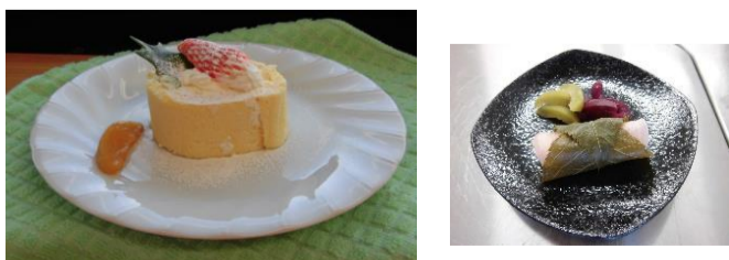
喫茶まつばら 第4金曜日