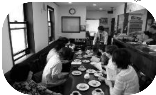
第二地区 「町会サロン」支援