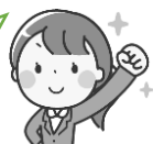
中央地区・松原地区 「中央地区福祉互助会かわり隊」・「松原サポート」支援