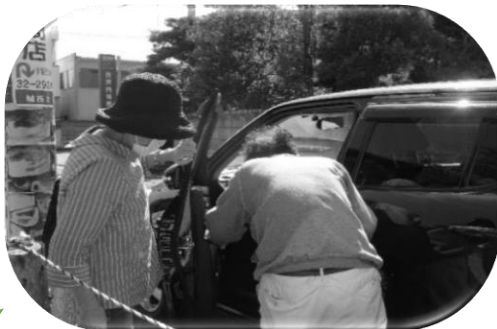
中央地区送迎サービス支援 「中央地区福祉互助会 おくるまおたすけ隊」