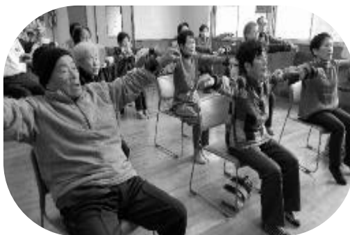
里山辺地区 「いきいき百歳体操」推進・立ち上げ支援