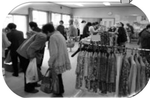
寿台地区 「寿台マルシェ」運営支援