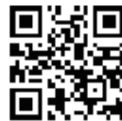
まつもとフィルム コモンズ