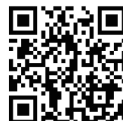
参考映像 (よみがえる安曇野)