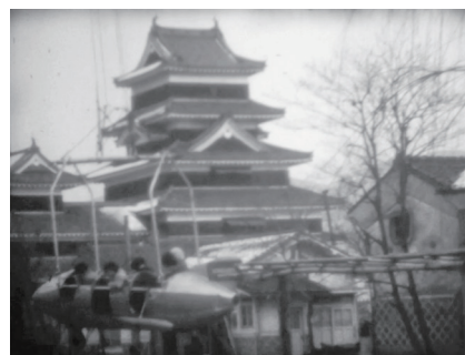
昭和37年 松本城と児童遊園地