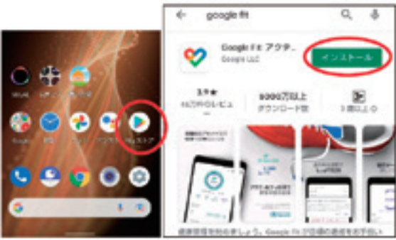
②Google Play ストアで「Google Fit」を検索し、インストール