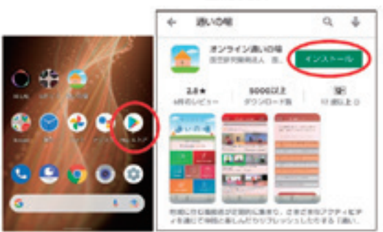
①Google Play ストアで「通いの場」を検索し、インストール