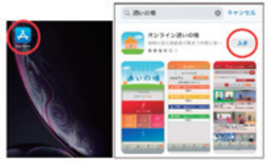
①App Storeで「通いの場」を検索し、インストール