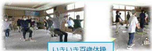
いきいき百歳体操 IN 南新中公民館