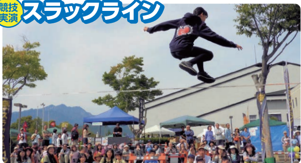
スラックラインラバース大町