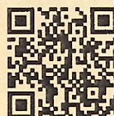
参考映像 (よみがえる安曇野)