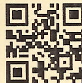
まつもとフィルム コモンズ