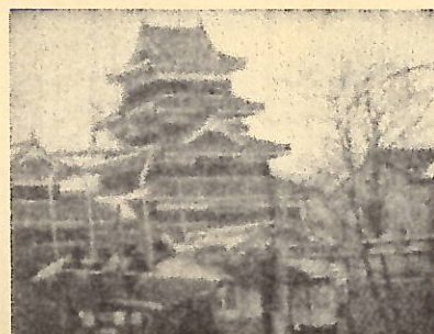
昭和37年 松本城と児童遊園地