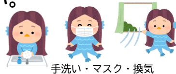
手洗い・マスク・換気

毎年高齢福祉課から発行されている入浴券がひろばでも受け取れます。70歳以上でご希望の方はひろばへお立ち寄りください。(受付期間は6月30日(木)まで)