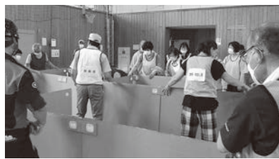
パーティションを組み立てている様子

山辺中 学校体 育館を 会場に 会場防 里山辺 地区防 災訓練 (避難所 開設訓 練)を行 いました。