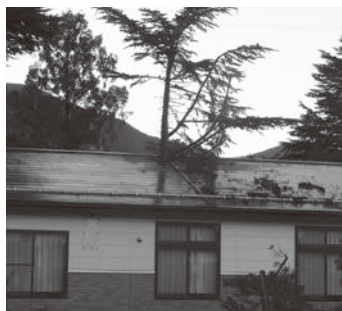
被害にあった旧福祉ひろば