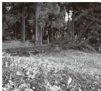
須々岐水神社の倒木

7月30日(土)、この日の午後は雲が広がり始め、雷が鳴り、局地的な雨が猛烈に降りだしました。次第に風も吹き始め、瞬間的に台風のような突風が一部の町会を襲い、各所で被害を出し、旧里山辺地区福祉ひろばの建物も被害にあいました。