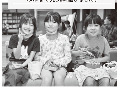
7/4 育成会バス学習会 みんなで元気に遊びました！