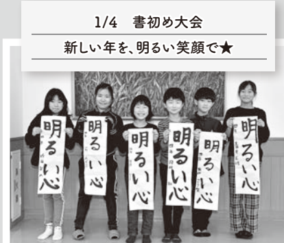
1/4 書初め大会 新しい年を、明るい笑顔で★