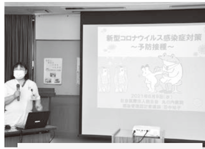
6/9 丸の内病院健康教室 コロナについて学びました。