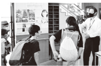
▲子ども達と語る館長 (右)

区公民館の防災・災害対策と少子高齢化の取組みの必要性を痛切に感じました。また令和2年2月22日開館20周年の節目として「城北公民館・福祉ひろば開館二十周年記念式典」等記念事業が盛大に開催されました。この直後、同年2月から新型コロナウイルス感染症拡大