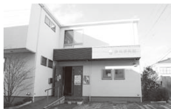
▲休館日を確認の上、お出かけください。

とが好きになり、小中学時代には「児童大賞」「住まいの絵画コンテスト」「花の児童画コンクール」などを受賞し、また数々の世界展で入選しています。父親が麻績村に移住したので、田舎詩情風景や農作業を見て感じた題材も多く、かたくなに描き続けた絵画と共に、詩人としての魂をこめた詩作や散文も一緒に紹介されています。ひたむきに生きることを見つめ、光と闇が交錯した独自の世界を、鉛筆・木炭・水彩・銅版画で描き、作品は、風景