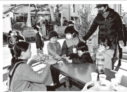
12/28 もちつき体験会 自分でついたお餅は美味しい！