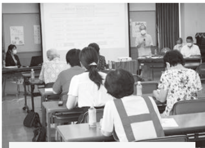
8/6 平和を語る会 性の多様性について学びました。