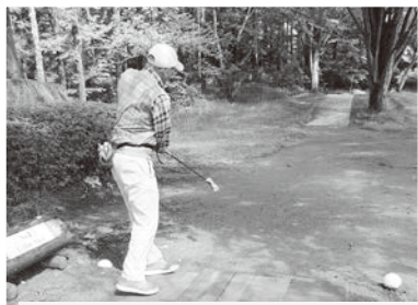
6/5 マレットゴルフ大会 ナイスショット！

館報「記録班」では、公民館の様々な事業に出向き、皆さんの活動の様子を記録しています。今回は令和3年度の記録の一部を公開します！