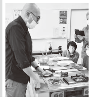
11/28 珈琲焙煎講座 珈琲の香りに癒されました。