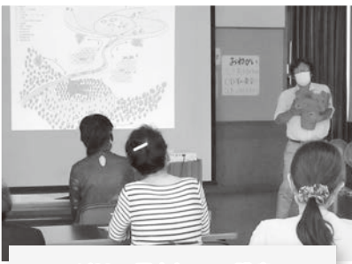
6/21 歴史とロマン講座 縄文土器を見ながら学習…