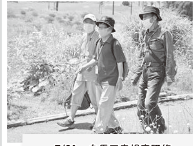
7/21 白馬五竜視察研修 高山植物を観察しました。