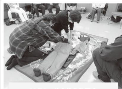
11/10 救命救急講習会 いざという時に助け合うために！