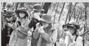
▲ルーベで植物観察する参加者