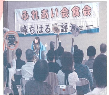
歌謡ショー（寿地区）