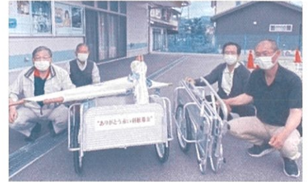
折り畳みリヤカーの購入（島内地区） （安心・安全なまちづくり活動公募配分）