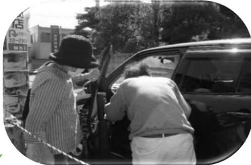
中央地区送迎サービス支援 「中央地区福祉互助会 おくるまおたすけ隊」