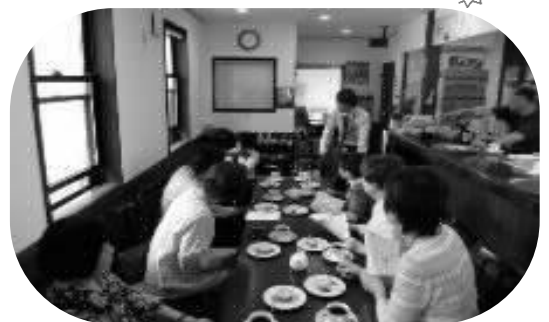
第二地区 「町会サロン」支援