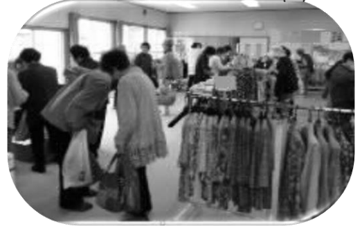
寿台地区 「寿台マルシェ」運営支援