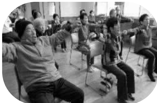
里山辺地区 「いきいき百歳体操」推進・立ち上げ支援