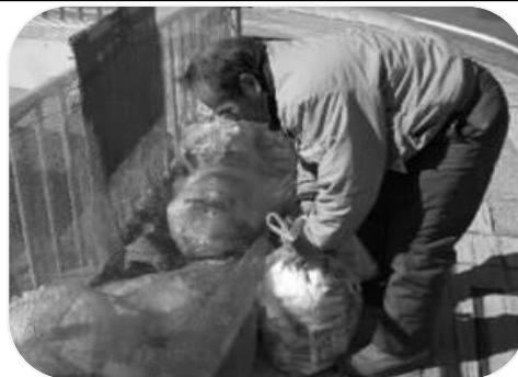
中央地区・松原地区 「中央地区福祉互助会かかわり隊」・「松原サポート」支援