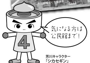
芳川キャラクター「シカセギン」