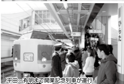
平田～有明まで開業記念列車が運行