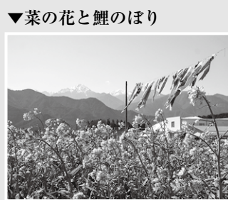
▼菜の花と鯉のぼり