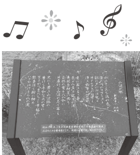
山辺のうた 歌碑 (場所：里山辺公民館駐車場)