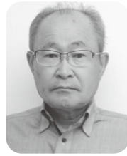
里山辺地区町会連合会 会長