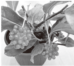
赤い球体の実を付けるサネカズラ

「いちよう並木 美男葛(ビナンカズラ)とも呼ばれるサネカズラ サネカズラは、マツバサ科サネカズラ属の常緑つる性樹木です。サネカズラは17種あり、日本にはこの内の2種が生息しています。サネは実を、カズラはつるを意味し、「実を付けるつる」という名の通り、和菓子の子を連想させます。観賞用にもとても人気のある植物です。 サネカズラの茎をむしり水でよく溶くと、粘性のある液体ができます。昔の男性はこの粘液を整髪料がわりに頭にぬり、髪を整え花柳界にくりだしていたことから、サネカズラは別名美男葛とも呼ばれています。 8月ごろ花が咲き、冬になると実ができます。実付きをよくするためには、強い直射日光を避け、根本の乾燥には注意してください。 リン酸カリ肥料を与え、剪定もしっかりと行なってください。 赤い球体の実を付けるサネカズラ