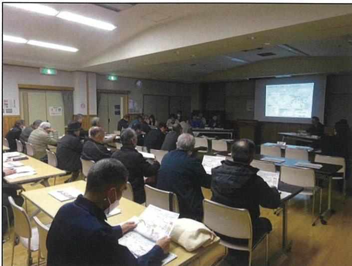
新村地区対策委員会の様子 (令和8年3月10日)

沿線4地区（島立・和田・新村・波田）の対策委員会が令和8年3月9日から12日にかけて開催されました。松本波田道路をはじめ、関連事業である松本環状高家線（仮称）新村バイパスや追加IC、中部縦貫自動車道先線（波田～中ノ湯）の状況について、各事業者から説明を行いました。