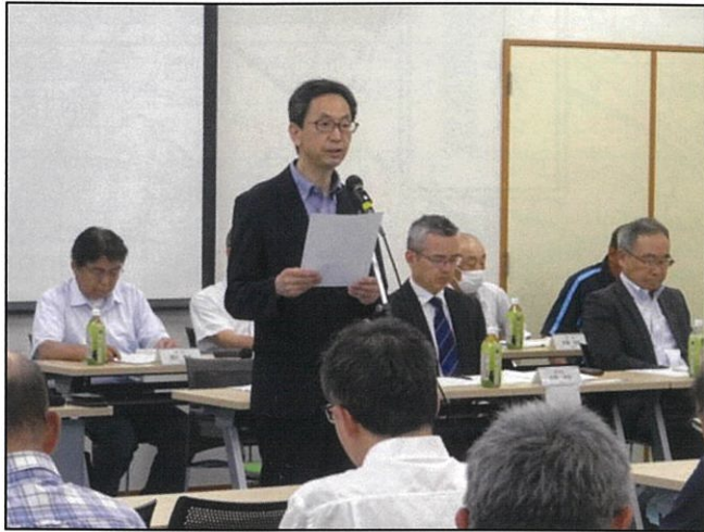
あいさつを行う奥原会長