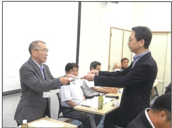
長野国道事務所へ要望書を手交