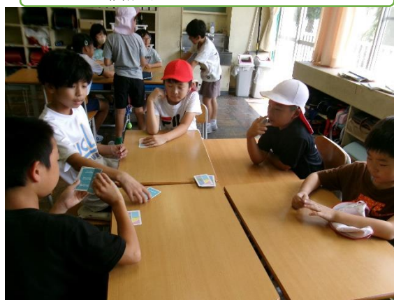
縦割り班のにこにこタイムで遊ぶ

学年の枠を越えた連学年、縦割り班活動や、一人ひとりが企画や運営を行い全員がリーダーとして活躍できる三大フェスなど、個性を大切にしながら、少人数のメリットを活かした活動を実践しています。地元の方を講師として招く縄ない教室や企業訪問など、地域とのつながりが強いのも小規模校ならではの強みです。