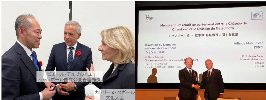
ピエール・デュブレユ シャンボール国立公園管理局長