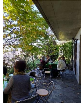
桂重英美術館(林町会)