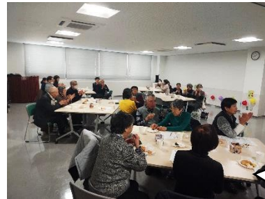
ご夫婦で参加した方もいて、会場はとても和やかでした