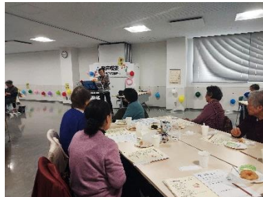
会場で知り合いの方との再会に喜ぶ方や、懐かしい歌に当時を思い出しました