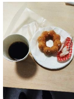
美味しいコーヒーとお菓子が好評でした