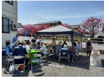
湯の原公民館西側駐車場