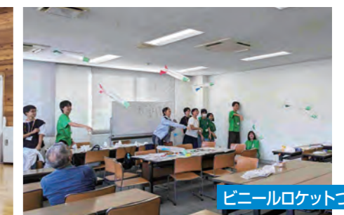
ビニールロケットづくり