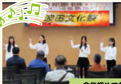
今年初めて参加しました！