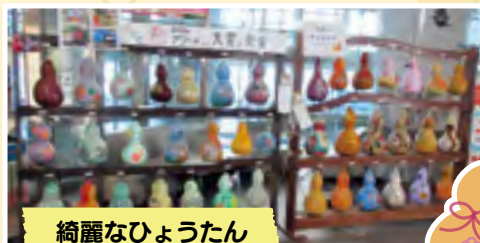
綺麗なひょうたん