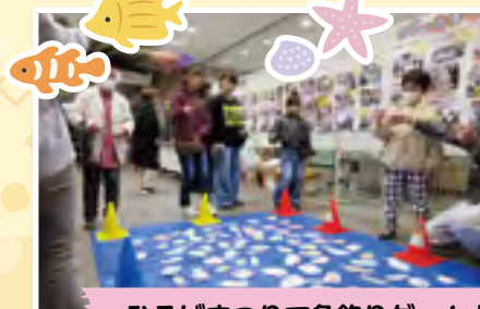
ひろばまつりで魚釣りゲーム！シャボン玉スティック作り！