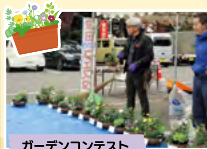
ガーデンコンテスト