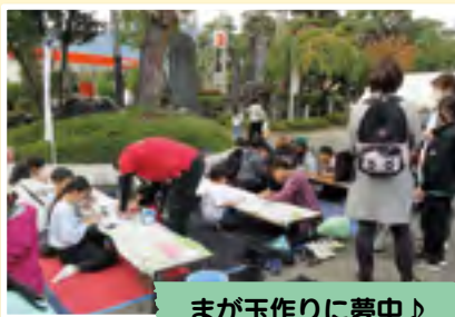
まが玉作りに夢中♪