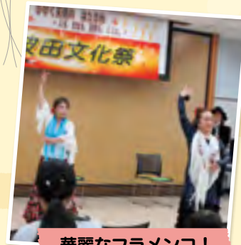
華麗なフラメンコ！