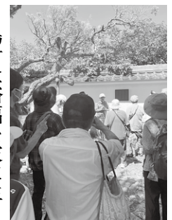
藤村記念館の庭にて

立派な門をくぐると、男性ガイドさんが待っていました。日本家屋の展示と二つの資料館に分かれて、作品原稿や資料等充実した多くの展示が。