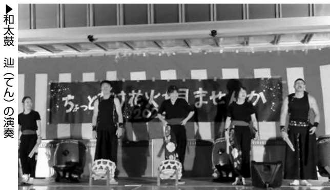
▶和太鼓連(てん)の演奏