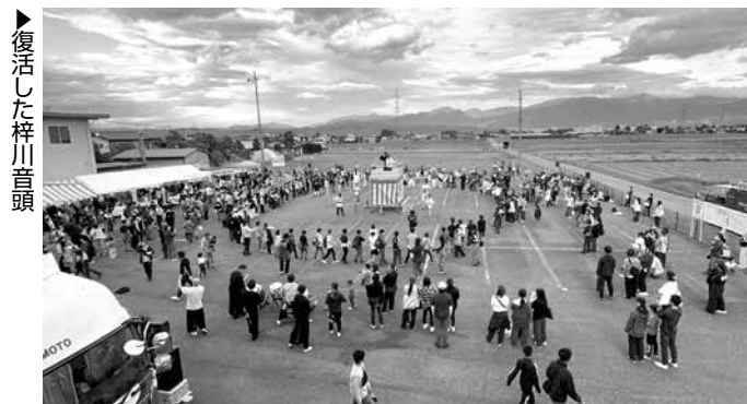
▶復活した梓川音頭