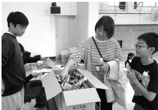
▶生徒が企画した宝探しで景品ゲット