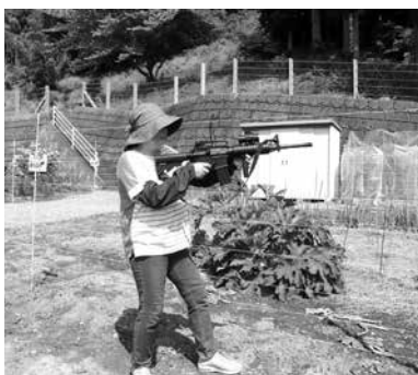
▲BB弾と電気柵による追払い

猿は食べ物があると繁殖して数を増やし、さらに被害が広がる恐れがあるため、猿がよく出る場所では柿の木の伐採もしています。外出の際や農作業中は十分にご注意ください。