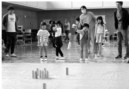
▶フィンランド発祥のモルツク