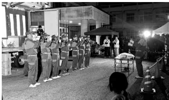
▲ラッパ隊の演奏や花火の警戒に消防団が出動