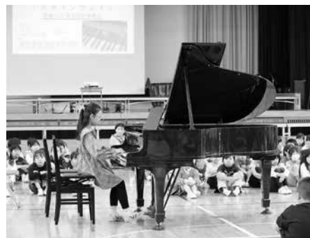
▲第1部 小学校児童による演奏