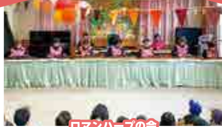
ロマンハーブの会