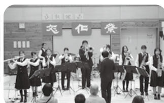
丸ノ内中学校 吹奏楽部