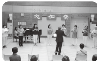
合唱 リモーネとオリーブ