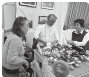
ひろば交流 パルーン