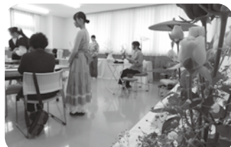
松本蟻ヶ崎高校 茶道部 お点前の披露 いけばな