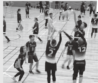
決勝リーグ5試合を戦い抜く