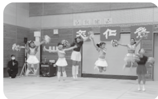
バントワリング 北部バトンクラブ