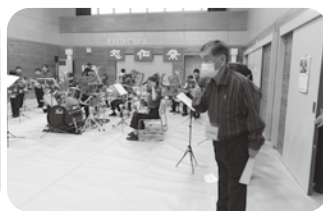
開会 実行委員長挨拶