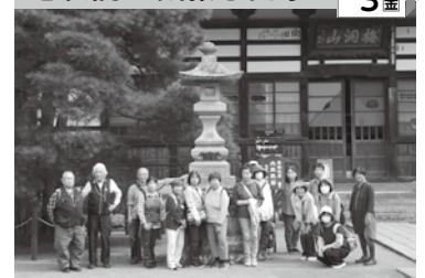
八方睨み鳳凰図の大きさは畳21枚分で、塗り替えは約180年間の間一度も行っていないことを学びました