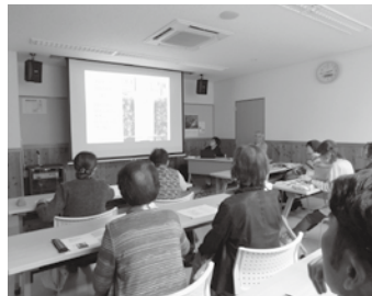
参加者11名 篤重界限のはなし 市民学会員の方々に講師に篤重の時代の本のこと、狂歌の町松本について学習会が開催されました