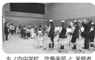
丸ノ内中学校 吹奏楽部 と来館者