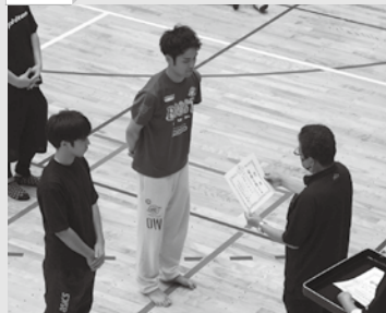
準優勝 賞状の授与式