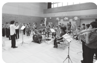
田川小学校 金管バンド