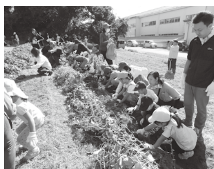
一列になってイモほり