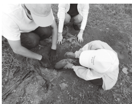
大きくてなかなか抜けない