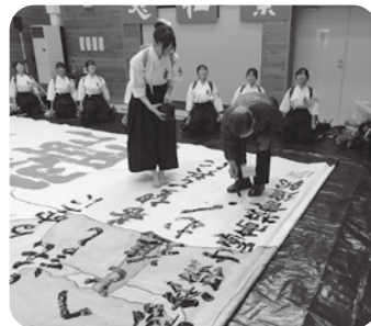
松本蟻ヶ崎高等学校 書道部 書道パフォーマンス