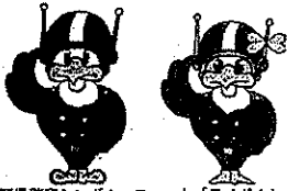
長野県警察シンボルマスコット「ライボくん ライビィちゃん」