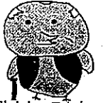
電話でお金詐欺防止キャラクター