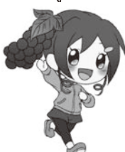
里山辺地区キャラクター さとちゃん