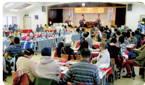
▲太鼓の演奏もお酒のおつまみになりました。