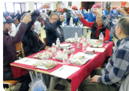
▲今年もおいしいお酒とおつまみにカンパイ!

「11月18日(土)13時〜15時」 コロナの影響も収まり、4年ぶりの開催となりました。久しぶりにお酒好きの皆さんの楽しみの会が、和太鼓演奏を合図に開かれました。参加者は141人で、お酒のお供は地元的女性たちの手作り18品目のおつまみです。 例年のごとく、最初に一口ずつ飲んだお酒の銘柄を、28種類のお酒の中からあてる利き酒が行われ、なんと的中者は5人も居ました。