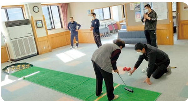
▲「スカットボール」といいます。スカットします(へへ)

「11月18日(土)13時〜15時」 コロナの影響も収まり、4年ぶりの開催となりました。久しぶりにお酒好きの皆さんの楽しみの会が、和太鼓演奏を合図に開かれました。参加者は141人で、お酒のお供は地元的女性たちの手作り18品目のおつまみです。 例年のごとく、最初に一口ずつ飲んだお酒の銘柄を、28種類のお酒の中からあてる利き酒が行われ、なんと的中者は5人も居ました。