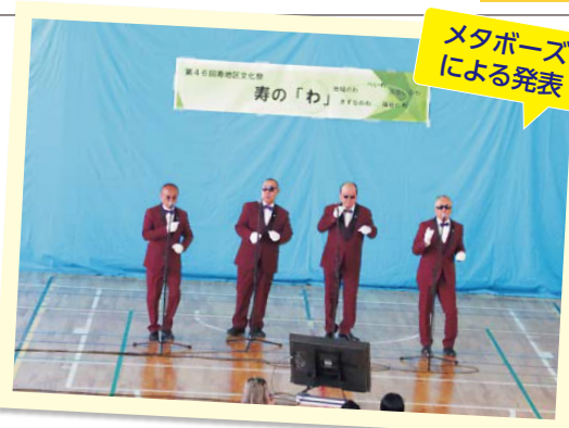
メタボーズによる発表

作品展示は、体育館にてサークル展示と、団体活動展示がありました。その団体は、書友会、季楽句会、きつつき会、寿花の会、寿地区福祉の文化祭作品等でした。