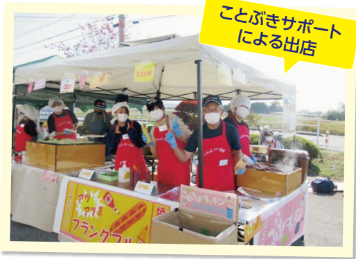
ことぶきサポートによる出店

9時40分、オープニングセレモニーとして、寿小学校4年生有志による「ダンス・タ伊ミング」を皮切りに、駐車場敷地では屋台村、体育館でのステージ発表・作品展示、福祉ひろばでのくつろぎコーナー等、開始されました。