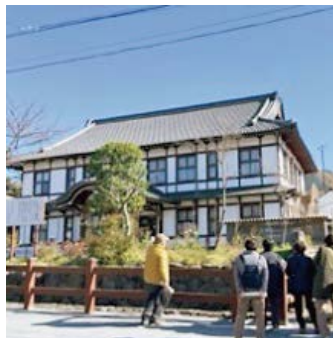
中野陣屋・県庁記念館

11月21日、小春日の中、まず初めに訪れたのは史跡公園として整備された『高梨氏館跡』(土壘・空堀・建物・庭園跡)、中野市教育委員会の方の説明を聞きながら見学しました。ご厚意で、続く『中野陣屋県庁記念館』についても説明していただきました。