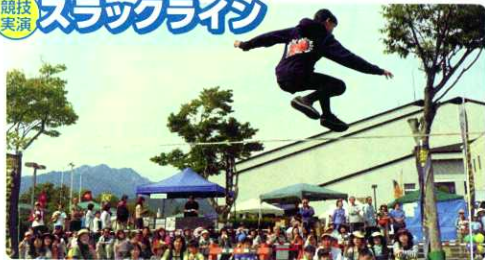
スラックラインラバース大町