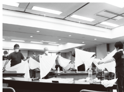
▲日本赤十字による応急処置講習会