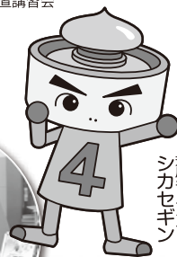
芳川まちづくり シカセキーン