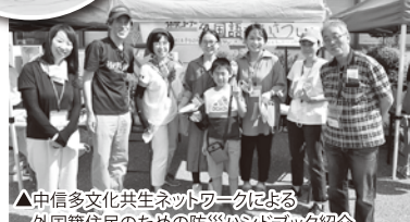
▲中信多文化共生ネットワークによる 外国籍住民のための防災ハンドブック紹介 外国語であいさつ体験