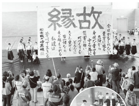
▲蟻高書道部による演舞披露

地元企業も参加し、災害時の簡易トイレなどの備蓄品の展示、PH E V車からの給電、段ボールベッドの組み立てなどを体験しました。 この日は、蟻ヶ崎高校書道部のパフォーマンスや、芳川名物となりつつある「芳川まるっと青空市」も開かれました。