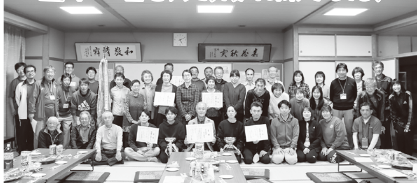
▲大会後、慰労会で参加選手の皆さんと功績を讃えました

10月8日に5年振りに地区対抗形式で開催された市民スポーツ大会で、芳川地区は総合優勝に輝きました。通算成績で芳川と島内が10回の優勝で並んでいましたが、今回で単独トップに立ちました。 ソフトバレーボールが40歳以上と39歳以下で優勝、軟式野球が準優勝、卓球とゲートボール女子が3位に輝きました。