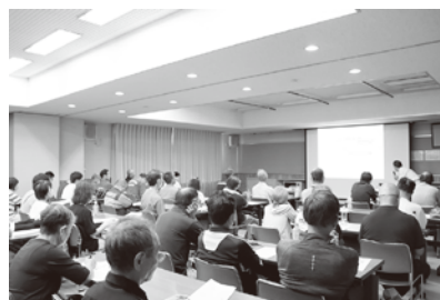
▲(株)サクセンによる市内断層についての講演

芳川地区は人口約1万7千人に対して、防災直後の指定避難所総収容人数は、約6千7百人です。 そこで、今回のフェスタでは「在宅避難」をテーマに必要な備えについて理解を深める機会を設けました。