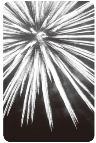
▲打ち上げ花火サイコー！

今年も花火を見ることが出来ました。心配していた台風之余波もなく、打ち上げ会場のそば畑周辺には300人ほどが集まりました。