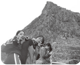
二〇〇一年から続く伝統の奥穂高岳登山を四年ぶり