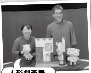
人形劇燕屋 8月10日(木)