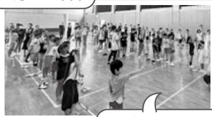
子ども会お楽しみ会(子ども会) 8月26日(土)