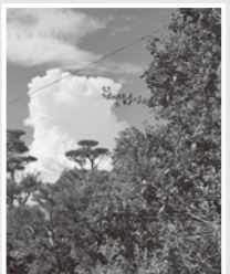
百日紅(サルズベリ)