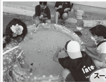
7/30日 三の宮町会 夏のつどい