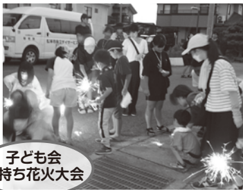
子ども会 手持ち花火大会