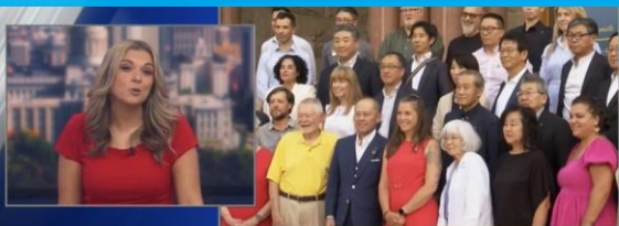
ABC4, Utah's First Television Station, Celebrates 75 Years!