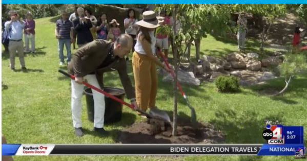
BIDEN DELEGATION TRAVELS NATIONAL

【ユタ大学ホームページ】 ソルトレーク市長と松本市長の 気候変動パネルディスカッションを ウィルクス・センターで開催