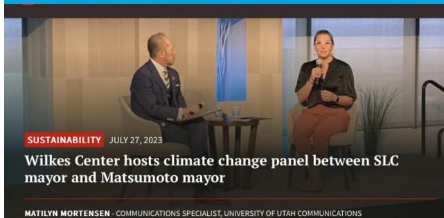
SUSTAINABILITY JULY 27, 2023

【ユタ大学ホームページ】 ソルトレーク市長と松本市長の 気候変動パネルディスカッションを ウィルクス・センターで開催