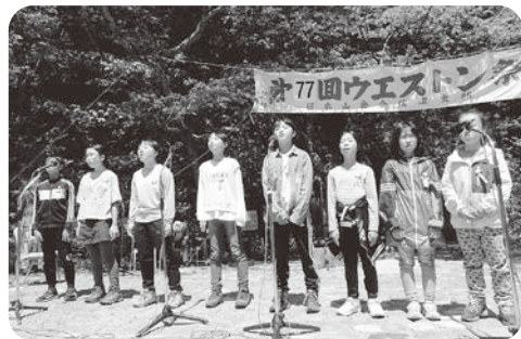
▲6/4 ウェストン広場に小学生の歌声がひびきます

も多少ありましたが、無事に峠小屋に到着することができました。そこからの山々の景色は素晴らしく、登ってきた甲斐があったなと感じました。今回の山行は例年より歩く距離が短かったですが、とても良い体験になりました。二日目はウェストン祭当日です。気持ちの良い天気の中、ウェストン碑まで歩き碑前祭を見ました。上高地を世界に広め、山に登る楽しさを紹介した功績を称えレリーフ前にて献花や合唱などが行われ、これからもこの碑前祭が続けば良いなと思いました。