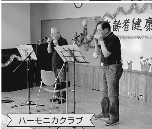
ハーモニカクラブ