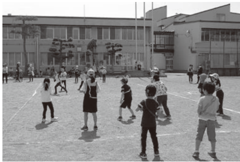
ボールを待ち構える子どもたち

5月21日、青空の下で子ども育成会球技大会が4年ぶりに開催されました。朝早くから役員が旭町小学校の校庭に