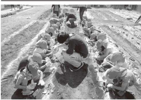
みんなで1本ずつ丁寧に植えました