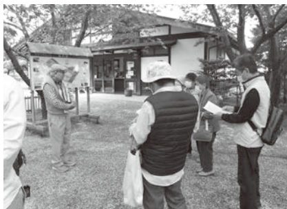
松本市歴史の里ボランティアガイドから説明を聞く参加者 (5月13日)

安原地区にある県宝橋倉家住宅を「見るだけの文化財から使う文化財へ」の思いから読書会は企画されています。