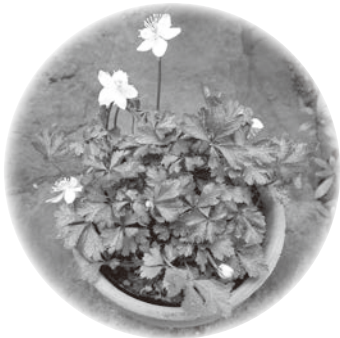
セリの葉と間違ふくらい似ているバイカオウレン

花の少ない時期に咲く花、可憐に愛らしく観賞価値は大、生臭い独特の臭いがあり室内に置くことはお奨めしません。昔から薬用植物として栽培