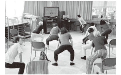
勇気を出して 問い合わせください。