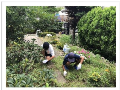
中学生夏休み体験学習（草取り）

地域の皆さんの中で支援できる方に協力会員として登録いただき、支援を必要とする方(利用会員)にちょっとした困りごとの支援を有償で行う事業。支援内容は、ごみ出し・草取り・雪かき。