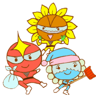
優しさあふれる隊