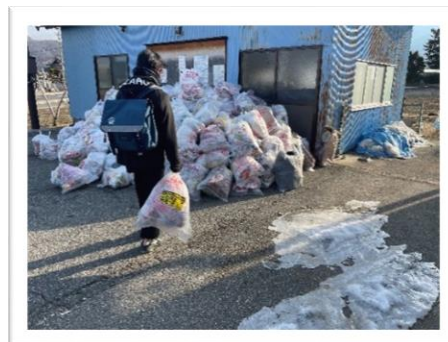
中学生による登校中のゴミ出し