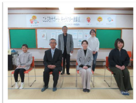
キャラクター募集の表彰式