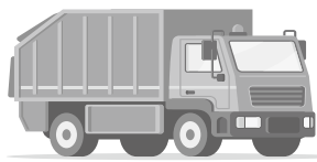
パッカー車(積込量2トン) 23,500台分!

少しの間で可燃ごみを減らし、リサイクルできる資源になります。これからはプラスチックごみの分別を意識しましょう。