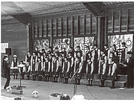
今年4月に行われた夫婦堤音楽祭の様子

コロナ禍で3年間地域の活動が衰退し、スポーツ、文化活動が思うようにできず、また子供たちには人生の記憶に残る大切な幼少期に、良き思い出を残してやれない歯痒さだけが心残りでなりません。5月からは2類感染症から5類に移行していく中で、子供たちの笑顔が戻り、活動かえってくる事を期待します。